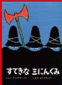
「すてきな三にんぐみ」、トミー・アングラー ©偕成社