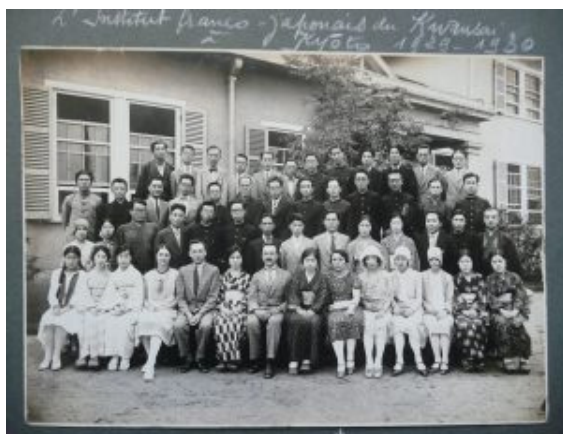
アンスティチュ・フランセ関西 創立90周年記念