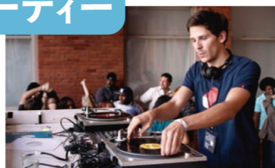
©2014 CG CINEMA - FRANCE 2 CINEMA - BLUE FILM PROD - YUNDAL FILMS

チケット販売：アンスティチュ・フランセ九州、 http://ptix.co/1F9FpKC