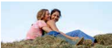
「美しい時」カトリーヌ・コルソニ(2016年配信作)