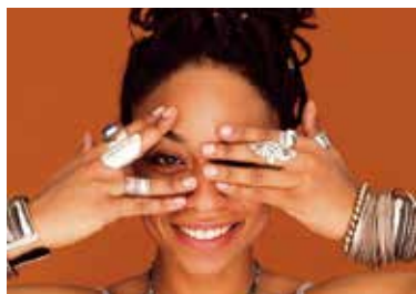
© Patrick dessinée par Paul-III. b, 2012

フランス語を話す9億人の人々が国境を越えて繋がる広い世界フランコフォニー。各国の音楽、美食、文学、芸術、映画をして言語を発見する世界一周の旅へ皆様を誘います。歌姫レティシア・ダナのライブもお楽しみに!