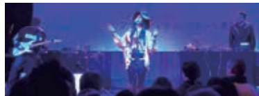
レヴュー・フ・フ・フ(2017)

多様性に満ちたフランコフォニー(フランス語圏)各国の音楽やダンス、食べものなどを楽しめるお祭り。 入場無料 / 飲食有料