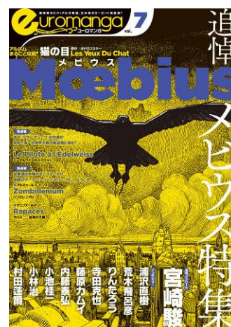
Numéro Hommage à Moebius d'Euromanga

Le salon Kaigai Manga Festa à Tokyo Big Sight, co-organisé avec l'Institut Français du Japon dans le cadre de Feuilles d'automne 2012 , a attiré quelques 10 000 visiteurs sur une journée qui ont pu ainsi découvrir la BD européenne dans sa diversité. L'Institut Français du Japon se voit ainsi récompenser du fruit de plusieurs années de travail dans la promotion de la bande dessinée au Japon aux côtés des éditeurs locaux, notamment Asuka Shinsha et Shogakukan Shueisha qui font figure de pionniers. D'autres éditeurs devraient prendre la suite, alors que la bande dessinée franco-belge arrive à un tournant majeur de son histoire au Japon.