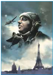
『星の王子さま』や『夜間飛行』等で知られるサン＝テグジュペリ。幼少の頃より飛行士に憧れ、パイロットとしても活躍しました。

バンドデザイン作家としてのキャリアは2006年に本 格的にスタート。これまでに「サン＝テグジュペリ」 シリーズ(Glénat, 2014年)、「les faucheurs de vent」(Glénat, 2017年)、「Forêts d'Opal」10巻 (Soleil, 2017年)、「Notre Dame de Paris, la nuit du feu」(Glénat, 2020年)、「Gravé dans le sable」 (Philléas, 2020年)など幅広いテーマで約20冊の コミックを描き、「La vélopostale」、「Rose Praline」など、 いくつかの児童書も出版している。 c.v.,ゲーム、書籍の表紙、雑誌等のイラストも数多く手 がけている。