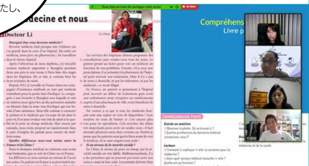
Zoomを使ったオンライン講座の様子

Zoomを使ってご参加いただけるオンライン講座も開講しています。ご自宅で受講されたい方にぴったりの講座です。