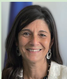
在京都フランス総領事 サンドリン・ムシェ