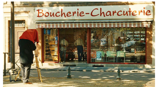
映画『旅する写真家 レイモン・ドゥパルドンの愛したフランス』(2012年)

フライヤー・広報用画像 | https://www.dropbox.com/sh/t7hmvh8wgkct2iw/AAAmTDGITDJDVLvy5NWRTVea?dl=0