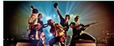
Balnearies Arts