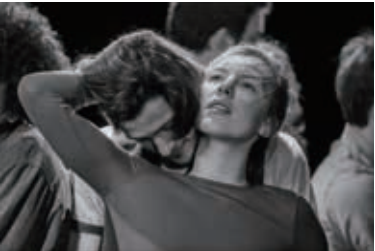
「おまの恋人」