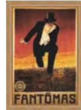
@ Jean Couaut