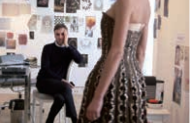
「ドールと私」