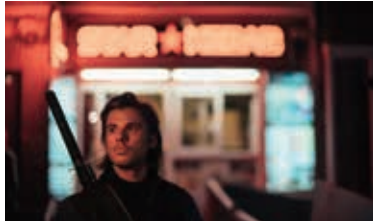
Orelsan