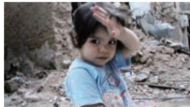
『シリア・モナムール』監督:オサーマ・モハンメド、フィアーム・シマブ・ベテルカーン