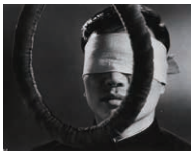
La Pendaïson (1968)

後援:駐日欧州連合代表部、日本弁護士連合会、 NPO法人CrimelInfo、アムネスティ・インターナショナル日本、死刑をなくそう市民会議