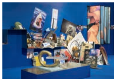
《青い狐》The Pale Fox 2014 チェンヘル・ギャラリーでの展示風景