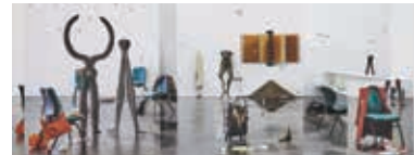
Emmanuelle Lainé "Suspension volontaire de la créduleité" 2019 La Friche Belle de Mai, Marseille, France