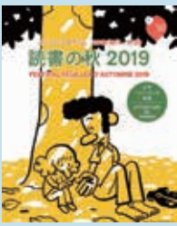
© Riad Sattouf / Allary Editions

協力：フランス語書籍専門出版社、ANA、フランス著作権事務所、フィリップ・ビキエ出版社、TV5MONDE