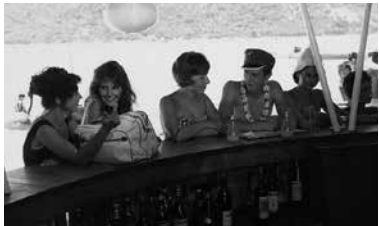
Adieu Philippine de Jacques Rozier 『アディー・フィリピーヌ』監督:ジャック・ロジエ

『シネ・リセ』は、若い観客たちに向けた映画講座です。上映の前には講師が解説し、映画への理解を深めます。500円 20歳前後の方を対象とした講座です。