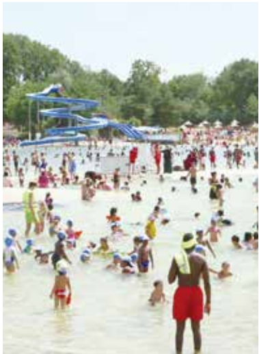
『宝島』監督:ギヨーム・ブラック(2018)