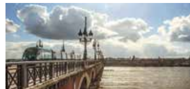
アキテーヌ地方の中心都市、ボルドーをご紹介します。