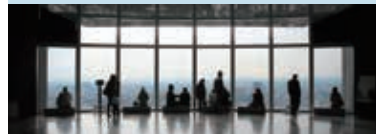
ティエリー・フルニエ『The Watchers』

ティエリー・フルニエの企画によるインスタレーション作品。マリーニジュリー・ブルジョフ、マリーヌ・バジェス、アントワヌ・シュミットの三名のアーティストが、森タワー52階から、東京の風景への新たな視線を提案します。