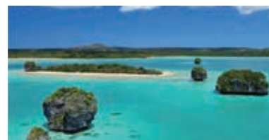
ニューカレドニア、イル・ド・ユーベ