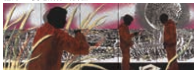
小瀬真由子 個展 'Vacuum' (2018年)