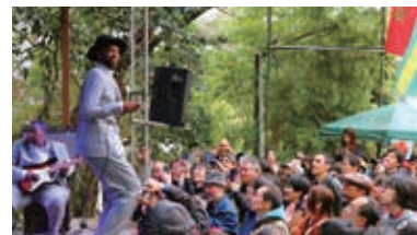
パルク・ド・フランス、2019年3月23日

プログラムは都合により変更されることがありますのでご了承ください。 詳細はウェブサイトをご覧ください。 Programme sous réserve de modifications. www.institutfrancais.jp/tokyo