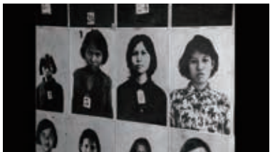
「消えた面 クメール・ルージュの真実」