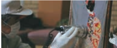
Hikaru Fujii, video in production, 2017