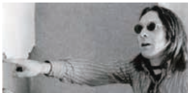
ジャン・ユスターシュ