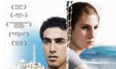
『ガザの海に浮かぶ小瓶』(2012年)

プログラムは都合により変更されることがありますのでご了承ください。詳細はウェブサイトをご確認ください。Programme sous réserve de modifications.