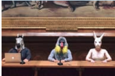
カトリヌ・バイ演出によるパフォーマンス「動物の裁判」