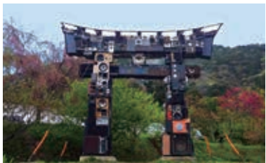
「できるセ・ポッシブル」