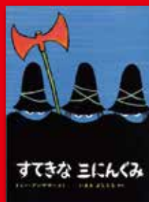
「すてきな三にんぐみ」、トミー・アングラー ©偕成社