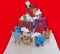
Les robots n'aiment pas l'eau, Philippe UG © Editions des Grandes Personnes