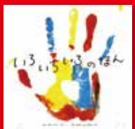
「いろいろなほん」、エルヴェ・テュレ ©ポプラ社