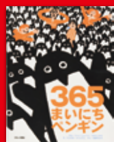
「365まいにちペンギン」、ジャン・リュック・フロマンタル、ジョエル・ジョリヴェ