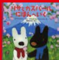
「リサとガスパールにほんへいく」、アン・クッドマン、グオルグ・ハレンスレーベ ©プロンズ新社