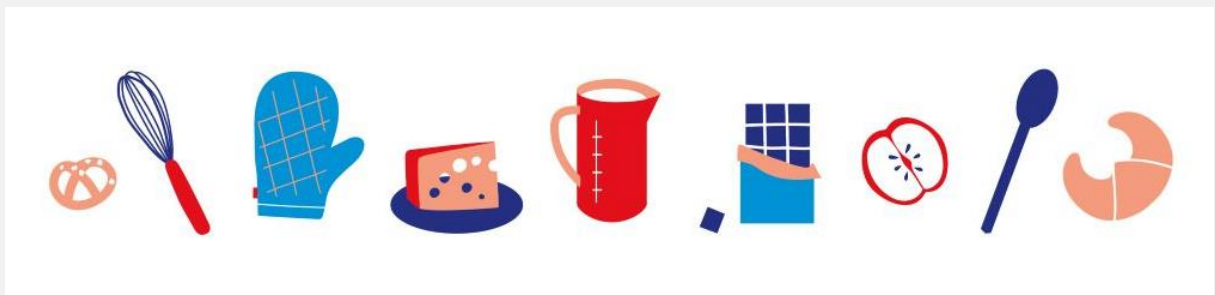
Illustration : Laurence BENTZ

本資料は日本語資料お茶の水女子大学「仏語圏言語文化論Ⅰ」（担当：小松祐子）の授業課題として翻訳されました。